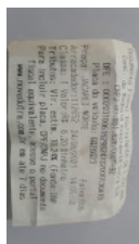
WhatsApp Image 2021-08-31 at 18.53.03.jpeg