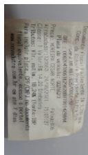
WhatsApp Image 2021-08-31 at 18.53.02 (2).jpeg