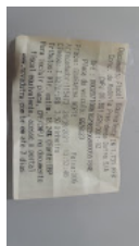
WhatsApp Image 2021-08-31 at 18.53.02 (1).jpeg