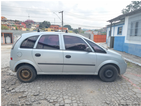
Lateral esquerda completa - -