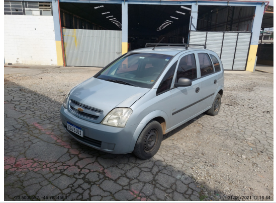
Angular esquerda dianteira - -