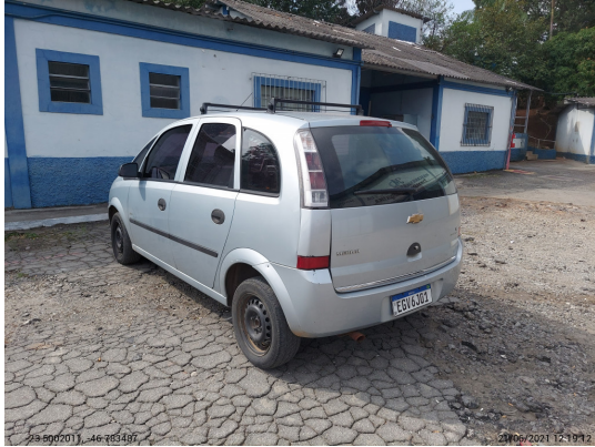
Angular traseira esquerda - -