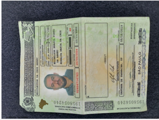
Documento com foto (CNH/RG/CPF) Verso - -