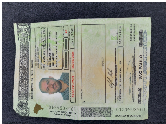
Documento com foto (CNH/RG/CPF) Frente - -