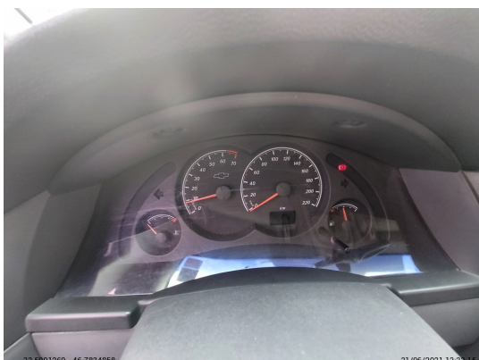
Painel ligado constando KM total e com conta-giros acima de zero - -