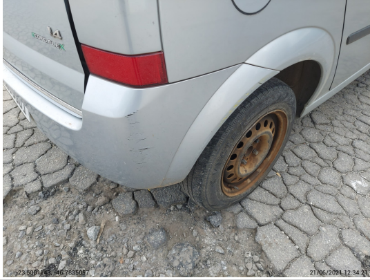
Avárias - Canto traseiro riscado - 25cm