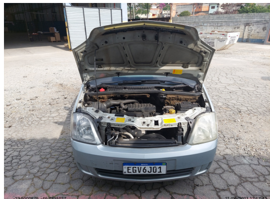
Motor com placa - -