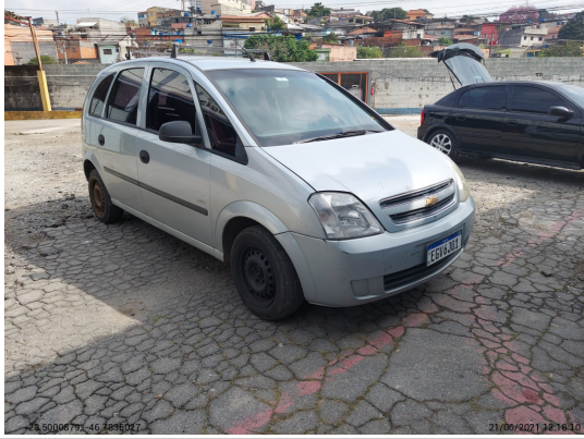
Angular direita dianteira - -