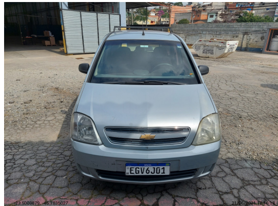
Dianteira - -