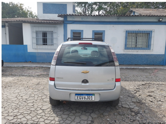
Traseira - -