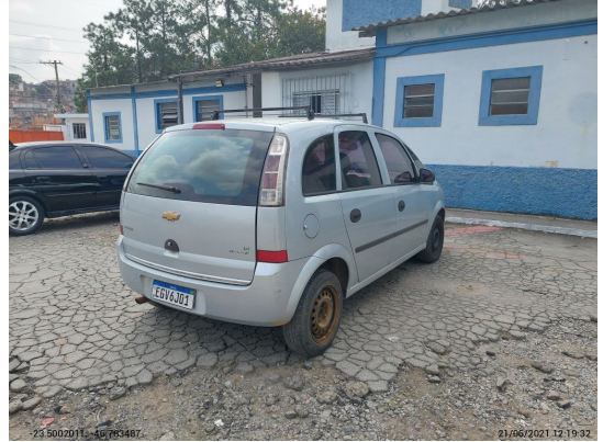
Angular traseira direita - -