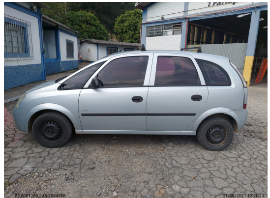
Lateral direita completa - -