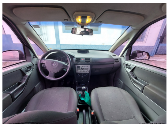
Painel tabelier com cambio visível - -