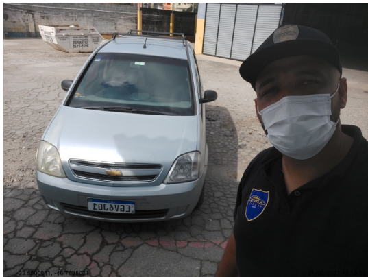
Selfie - -