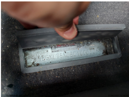
Chassi legível - -