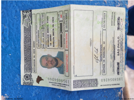
Documento com foto (CNH/RG/CPF) Verso - -