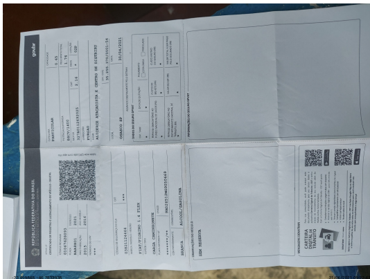
CRLV aberto - -