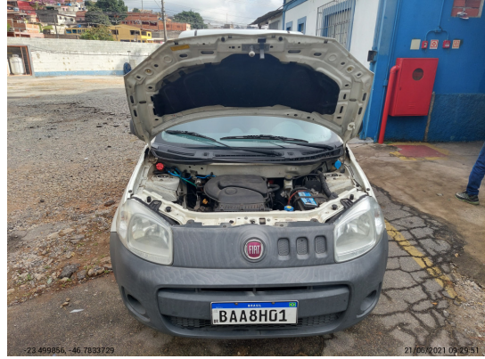
Motor com placa - -