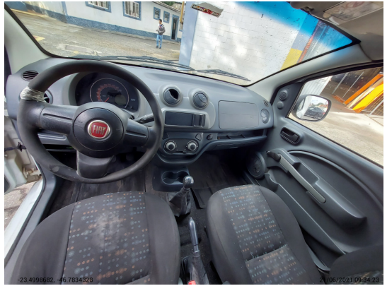
Painel tabelier com cambio visível - -