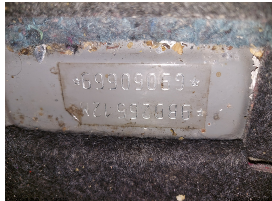
Chassi legível - -