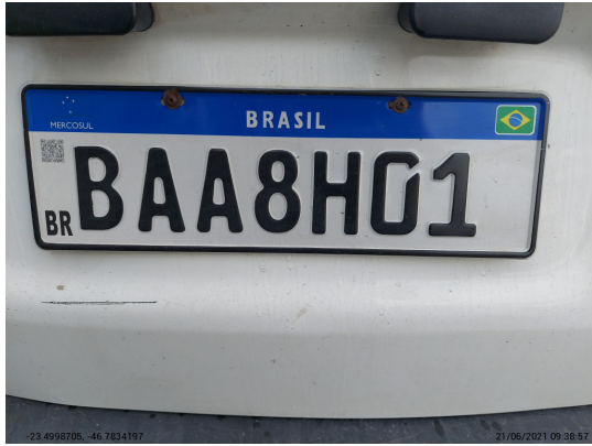
Placa traseira com selo - -