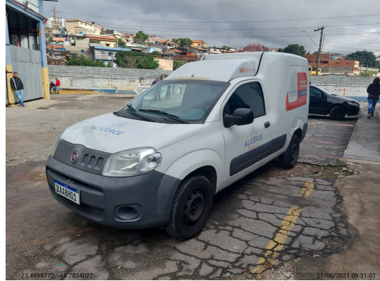
Angular esquerda dianteira - -