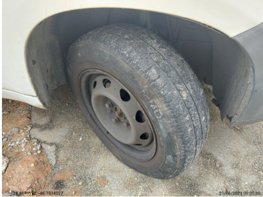
Pneu dianteiro direito - -