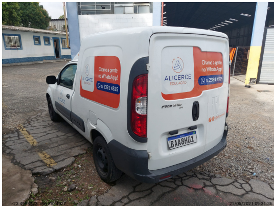
Angular traseira esquerda - -