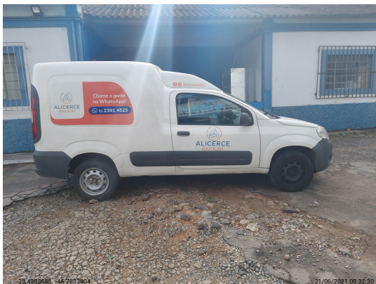
Lateral esquerda completa - -