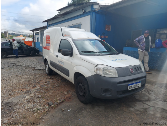
Angular direita dianteira - -