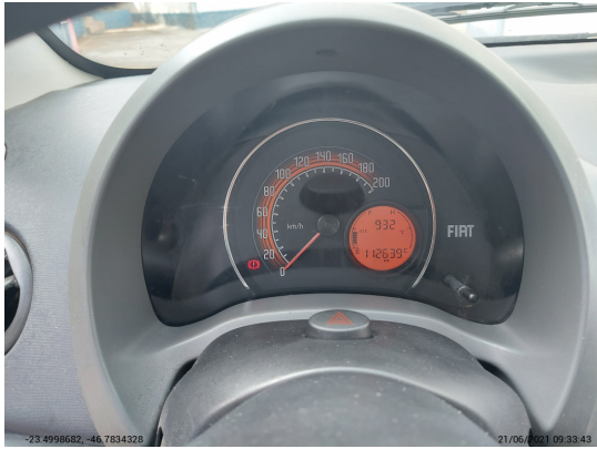
Painel ligado constando KM total e com conta-giros acima de zero - -