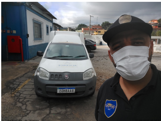
Selfie - -