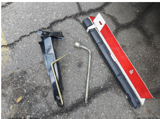
Acessórios fora do veículo - -