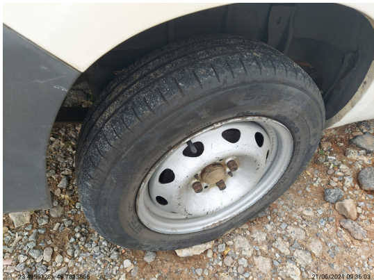
Pneu traseiro direito - -