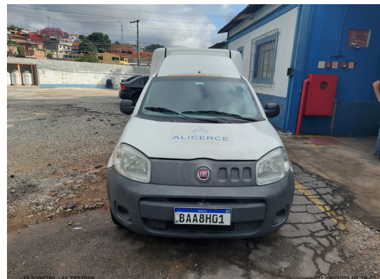
Dianteira - -