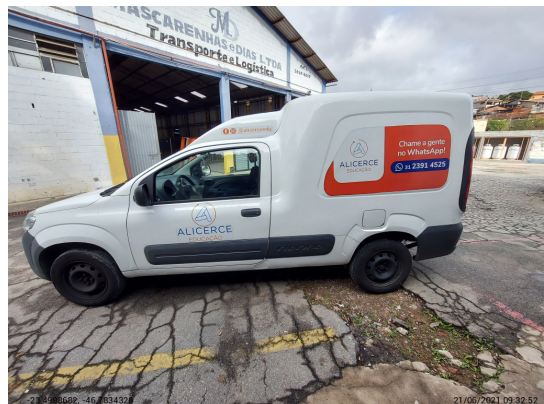
Lateral direita completa - -