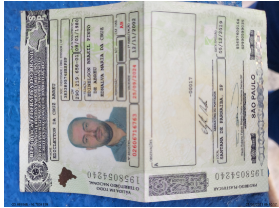
Documento com foto (CNH/RG/CPF) Frente - -