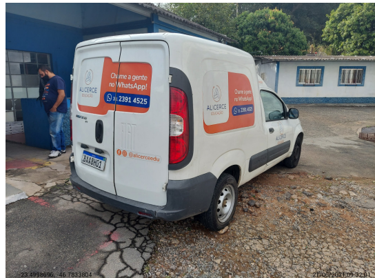
Angular traseira direita - -