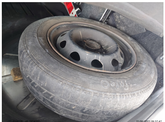
Estepe - -