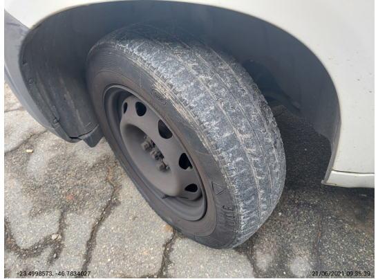
Pneu dianteiro esquerdo - -