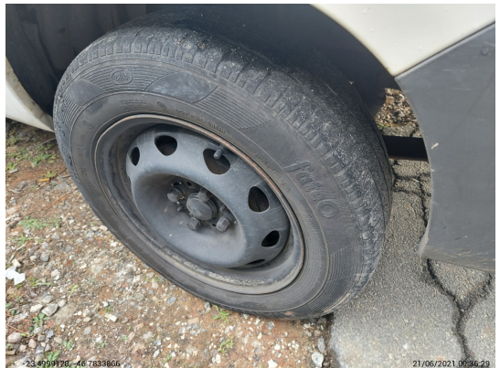
Pneu traseiro esquerdo - -