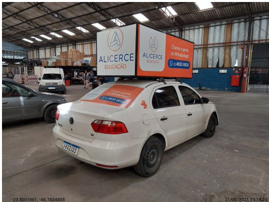
Angular traseira direita - -