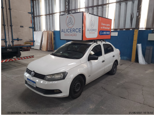
Angular esquerda dianteira - -