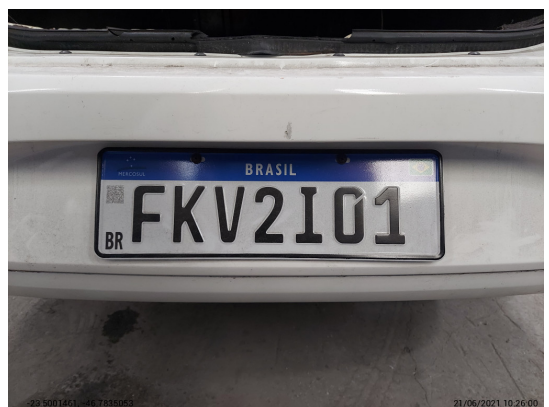
Placa traseira com selo - -