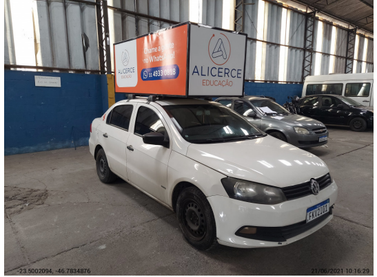
Angular direita dianteira - -