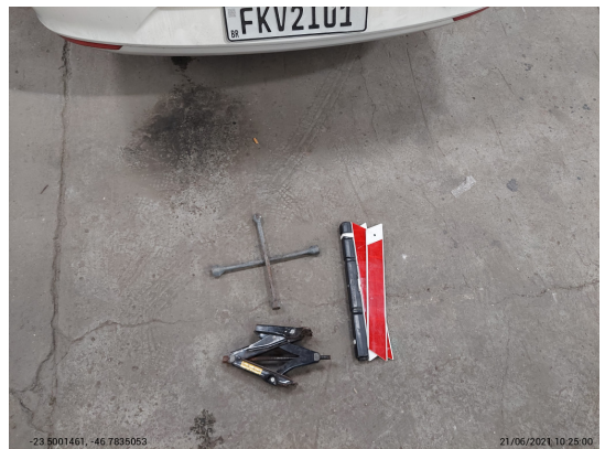
Acessórios fora do veículo - -