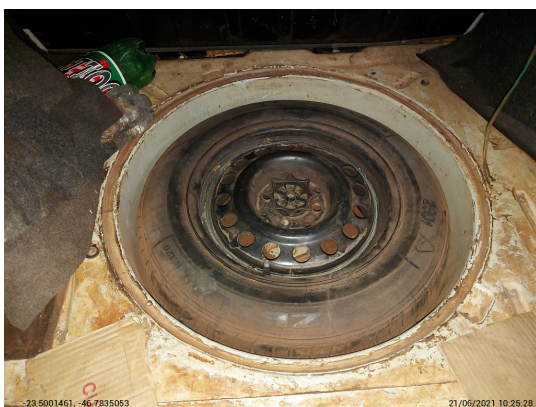
Estepe - -