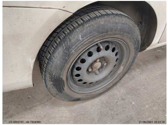
Pneu traseiro direito - -