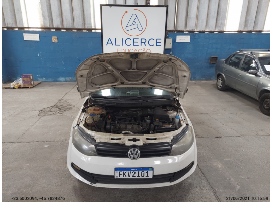
Motor com placa - -