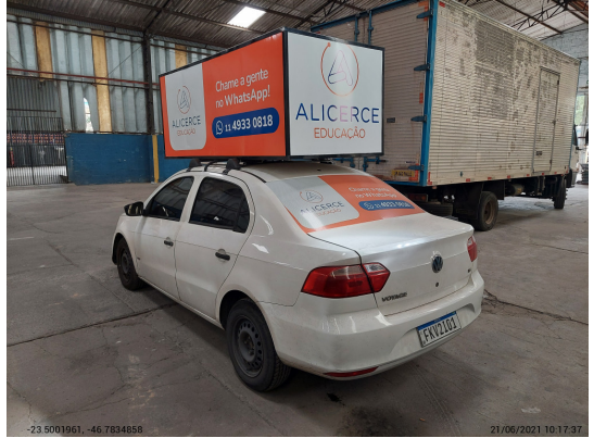
Angular traseira esquerda - -