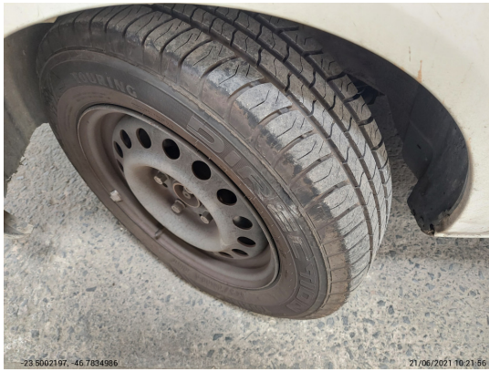
Pneu dianteiro esquerdo - -