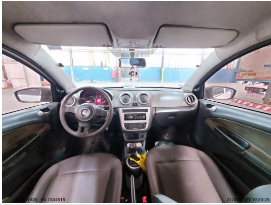
Painel tabelier com cambio visível - -