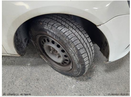
Pneu dianteiro direito - -