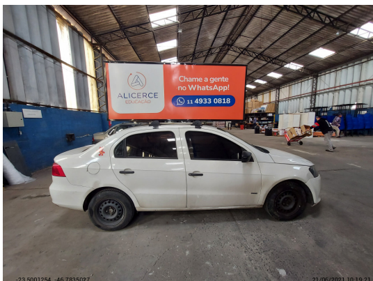
Lateral direita completa - -