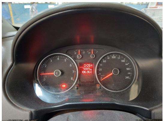
Painel ligado constando KM total e com conta-giros acima de zero - -