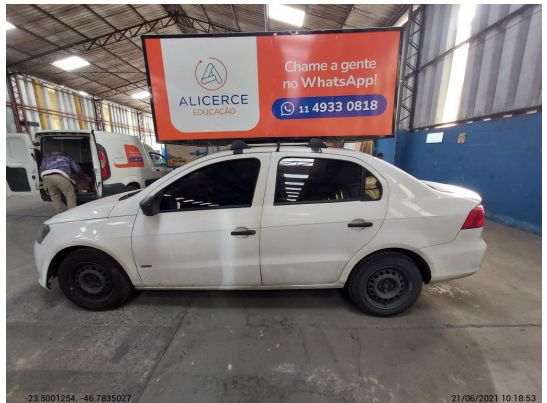
Lateral esquerda completa - -