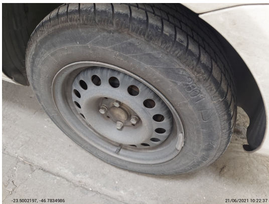
Pneu traseiro esquerdo - -